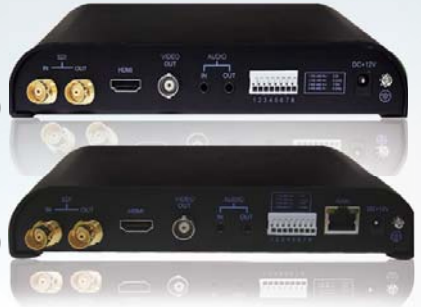
SSD-RX011N 网路型 讯号转换器 (有PoC功能)