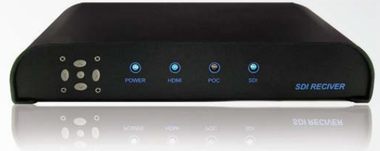
SSD-RX011 一般型 讯号转换器 (有PoC功能)