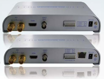
SSD-RX010N 网路型 讯号转换器 (无PoC功能)