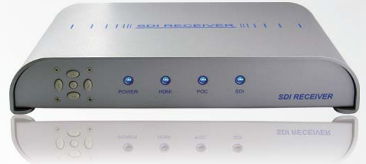
SSD-RX010 一般型 讯号转换器 (无PoC功能)